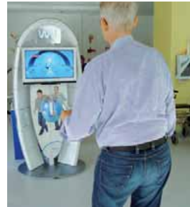
Abb. 6 Wii Play Motion

Wii Play Motion > Um Reich- und Greiffunktionen auf hohem Niveau kombiniert zu trainieren, steht den Patienten ein weiteres Programm zur Verfügung: die Wii Play Motion. Man benötigt die Wii Spielekonsole und einen Adapter für die zwölf Spiele. Diese erfordern eine angemessene Bewegungsgeschwindigkeit und -koordination sowie exakte Handgelenksbewegungen. Nur wenn der Patient die Bewegungen sauber ausführt, registriert sie ein Sensor und überträgt sie auf den Bildschirm.