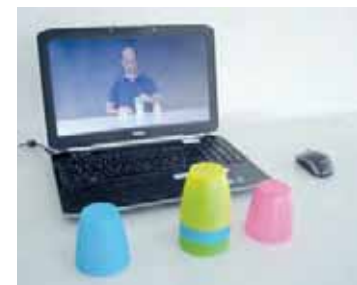
Abb. 2 Physiofun Senso Move

1995 bewies der Neurophysiologe Rizzolatti, dass nur das Betrachten einer motorischen Bewegung bestimmte Areale im Hirn aktiviert und eigene Funktionen anbahnt [5]. Dieses Prinzip nutzt auch das Softwareprogramm Physiofun Senso Move: Der Patient betrachtet Videosequenzen von Alltagshandlungen, zum Beispiel den Becher zum Mund führen, den Tisch abwischen etc. Zuerst soll er die Sequenz aufmerksam beobachten. So werden im prämotorischen Kortex die Spiegelneuronen aktiv, die den motorischen Kortex aktivieren – als würde man die Bewegung selbst ausführen. Anschließend soll sich der Patient die Bewegung so vorstellen, als würde er sich selbst bei der Ausführung beobachten beziehungsweise während der Ausführung in seinem Körper stecken. Dieses Prinzip des mentalen Trainings findet man auch im Leistungssport, wenn es darum geht, einen Bewegungsablauf zu erlernen oder zu verbessern. Zum Schluss führt der Patient die Sequenz in seinen motorischen Möglichkeiten aktiv durch, was wiederum den (prä-)motorischen Kortex aktiviert [6].